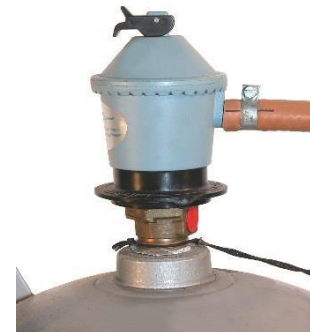
Paineensäädin kiinnitettynä kaasupulloon.

Uusi EN16129 standardin mukainen säädin jossa kytkin on säätimen sivussa.